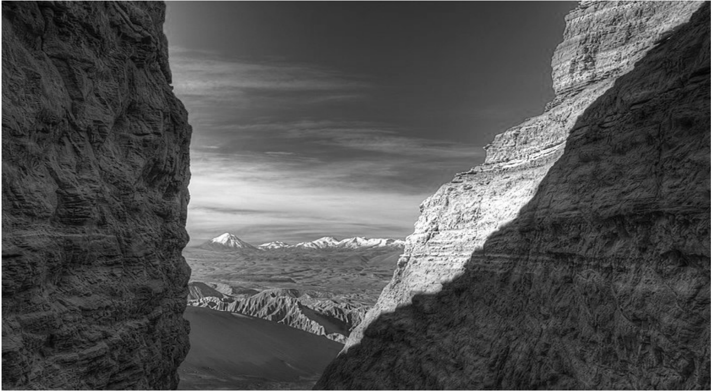
Le désert d'Atacama, par Frodosleveland 14/06/2012 https://creativecommons.org/licenses/by-sa/4.0/