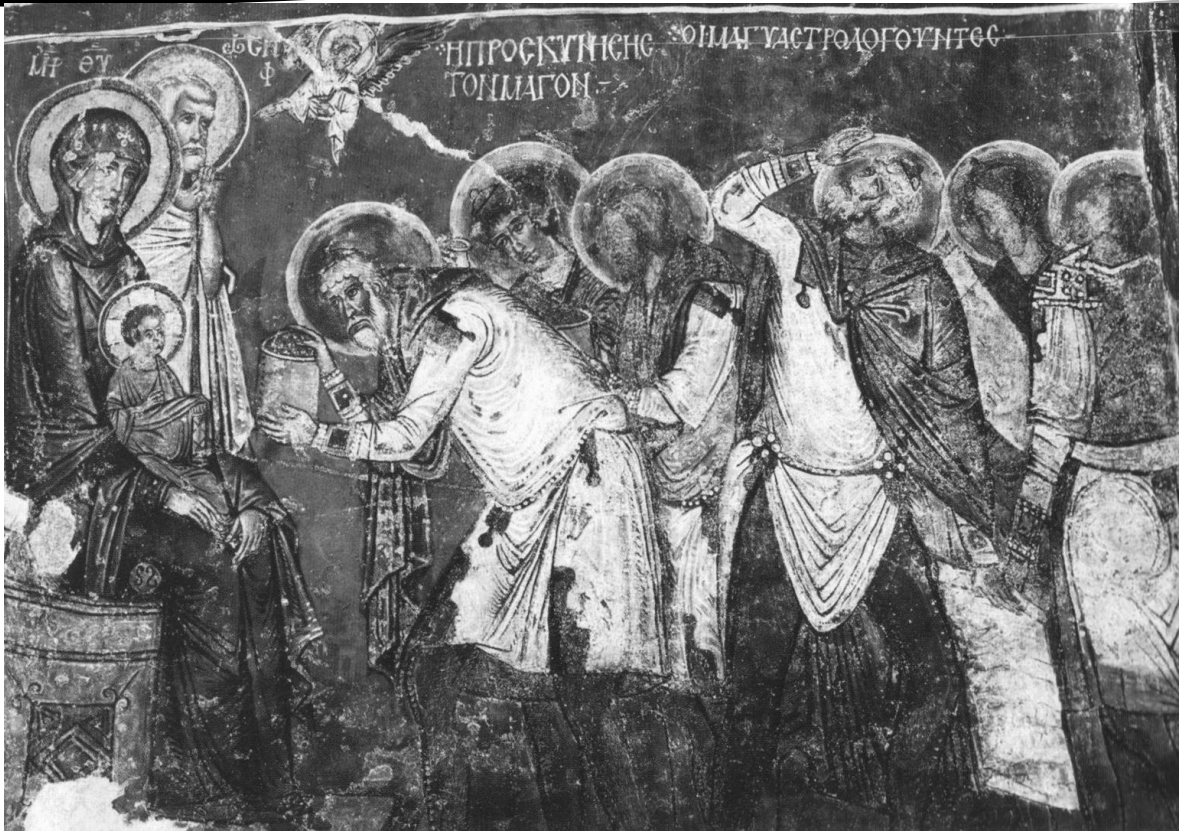
L'adoration des mages. Fresque de Cappadoce