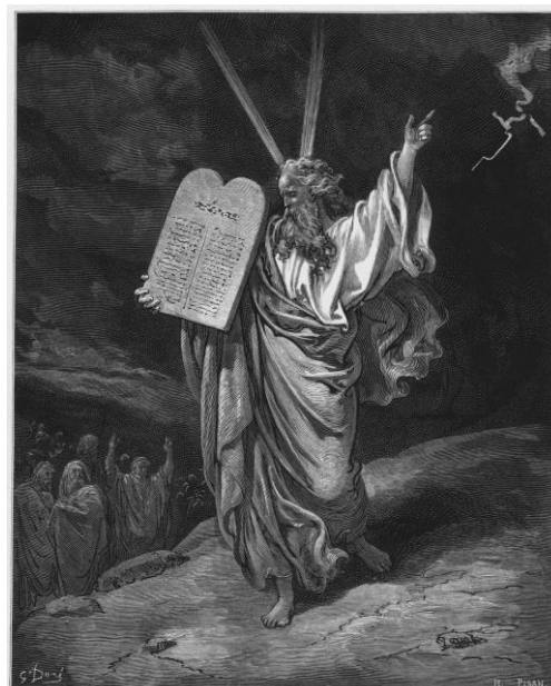
Moïse descendant du mont Sinä avec les tables de la loi (Gustave Doré), 1866