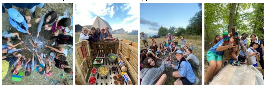
Photos du camp louvetaux été 2023, jumelé avec la meute de Rouen