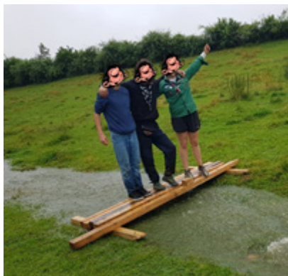
La tempête a laissé derrière elle un ruisseau qui séparait notre lieu de camps en deux. Nous avons construit un pont de fortune pour relier les deux parties.