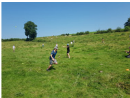
Les éclais jouent à la thèque.