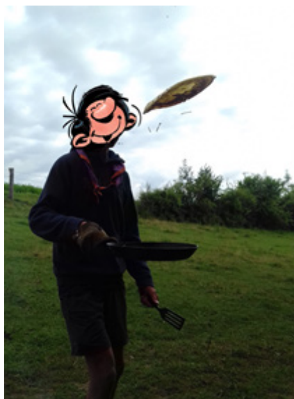
Préparation de crêpe au feu de bois.