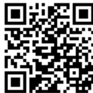
QR code pour vous connecter à la page Facebook